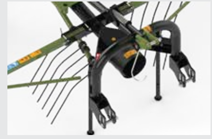
Güçlü üç nokta askı bağlantı sistemi

● Güvenli kullanım için kolayca ayarlanabilen yol ve iş konumu özelliği bulunur.